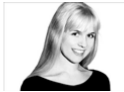
von Linda Schnauer

Es ist der Traum eines jeden ambitionierten Amateur-Golfers: Ebenso wie Woods, Els und Langer selbst einmal seine eigene, maßgefertigte Golfausrüstung zu besitzen und mit solchen Präzisionsinstrumenten auf Handicap-Jagd gehen.