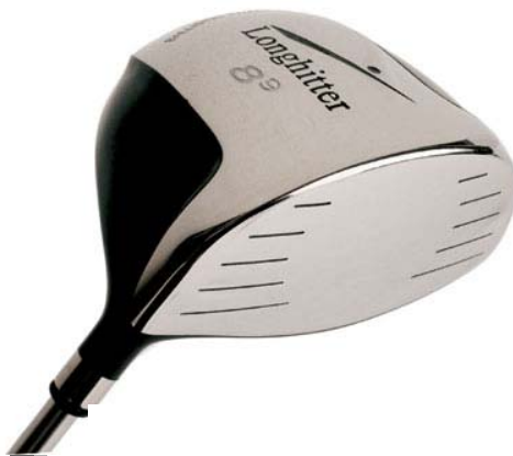
LONGHITTER Driver: eine elegante aber brand-gefährliche Waffe!

...sichert ein Optimum an Leistung!“ Mit diesem Slogan wirbt LONGHITTER® für seine handgefertigten Golfschläger. Was ist dran an diesem Slogan, der schon mehr wie ein Versprechen klingt?